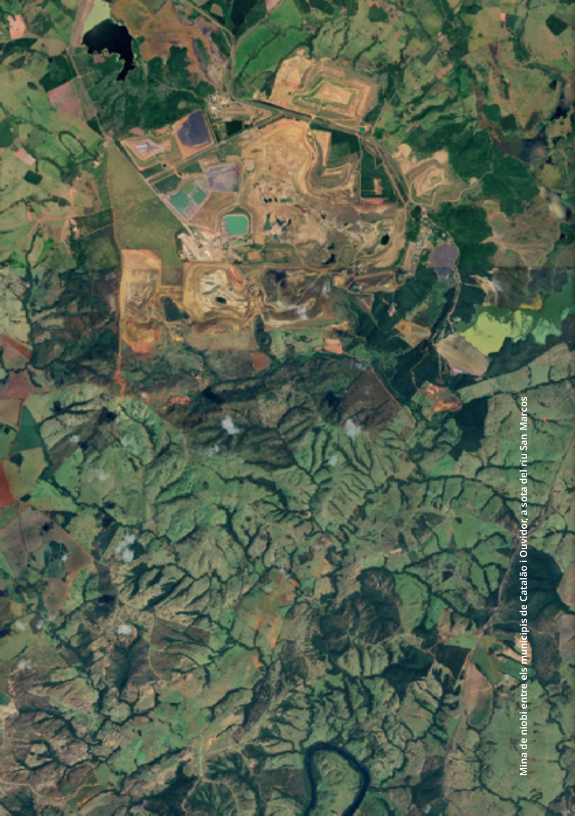
Mina de niobi entre els municipis de Catalão i Ouvidor, a sota del riu San Marcos