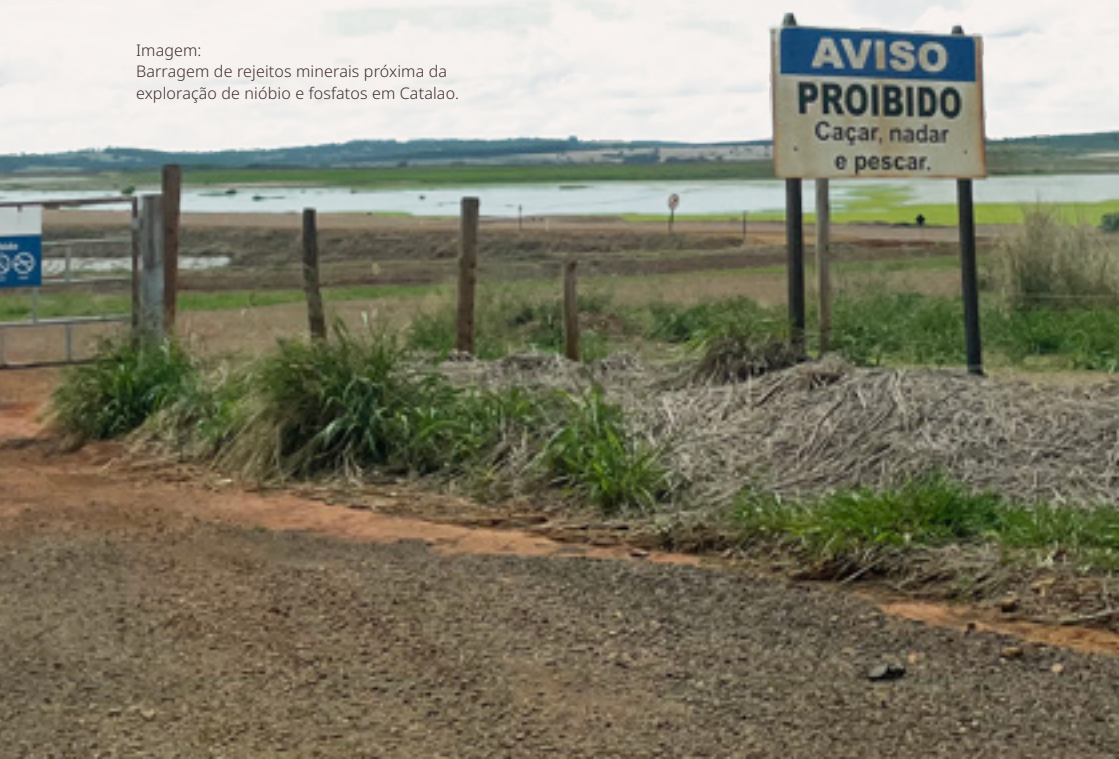
Imagem: Barragem de rejeitos minerais próxima da exploração de nióbio e fosfatos em Catalao.