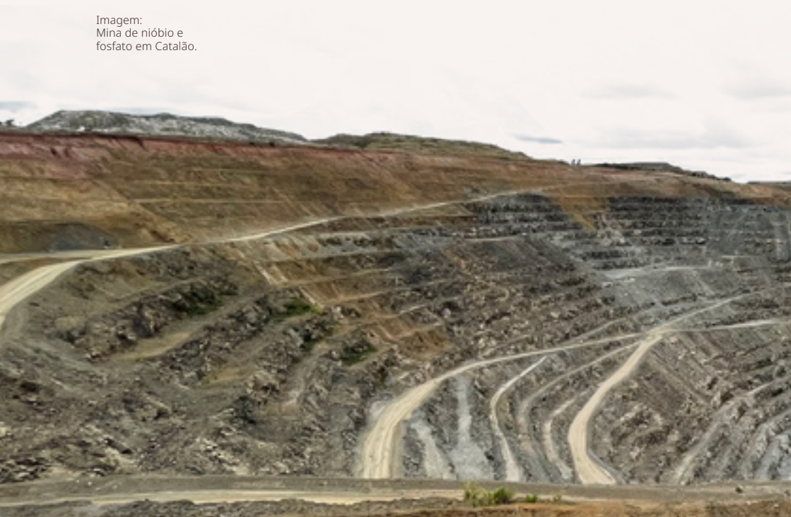
Imagem: Mina de nióbio e fosfato em Catalão.