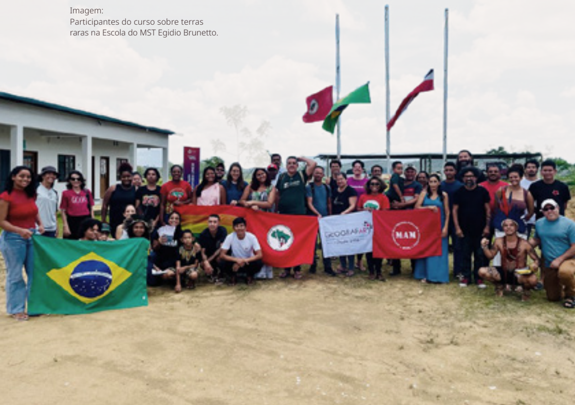
Imagem: Participantes do curso sobre terras raras na Escola do MST Egidio Brunetto.