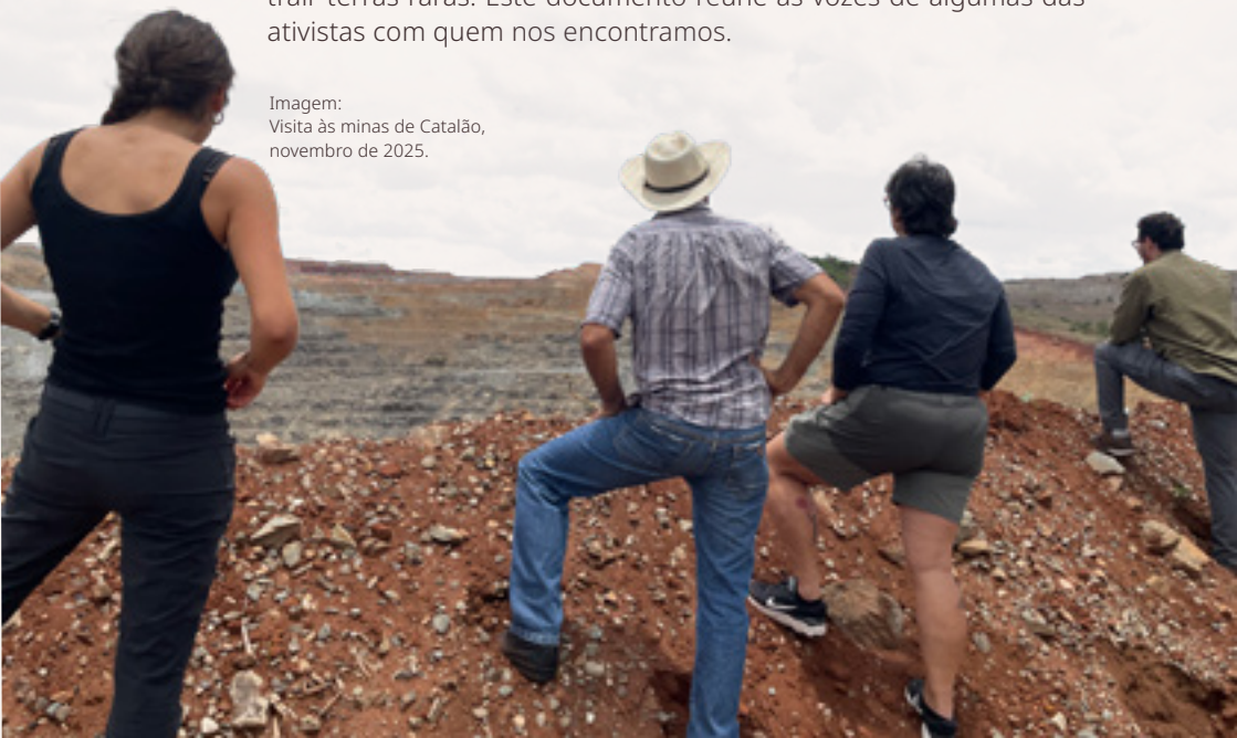
Imagem: Visita às minas de Catalão, novembro de 2025.