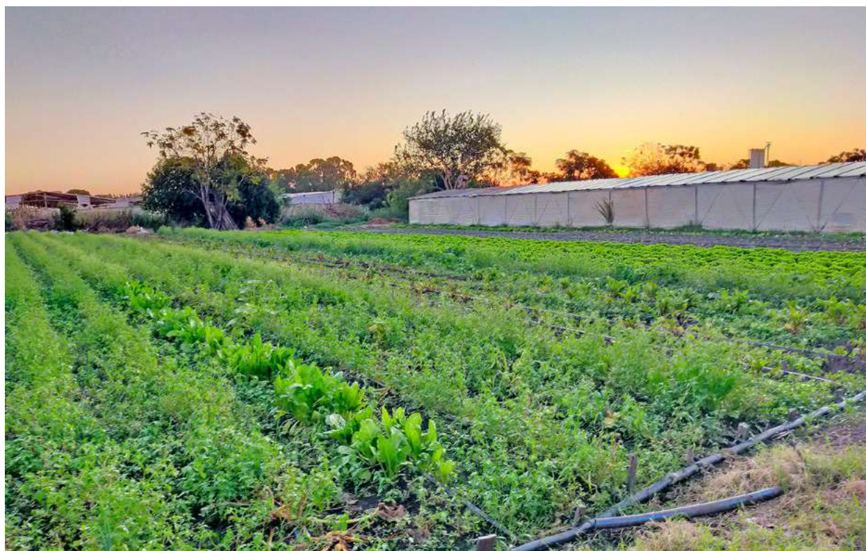
Visita al huerto de una productora de la Federación Rural en el cinturón agrícola de La Plata. (Laia Baró Gómez).