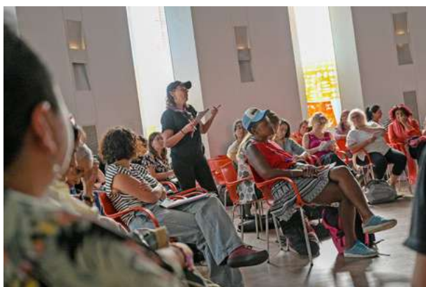
Sesión de la Comisión "Tiempos y Miedos" en Buenos Aires.