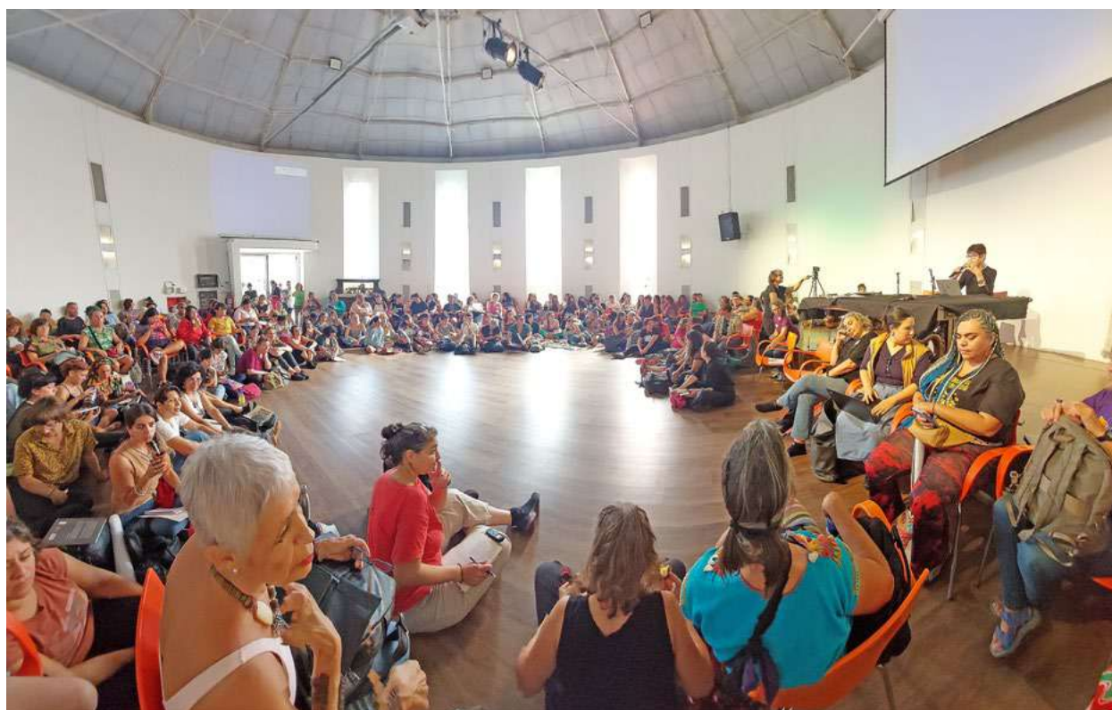
Sesión plenaria de clausura del I Encuentro de Economía Feminista de Abya Yala, el 28 de marzo de 2025. (Blanca Bayas Fernández, ODG).

E l año 2025 está marcado por la lógica de un sistema biocida: más prácticas extractivistas, más acaparamiento económico en pocas manos y más privatizaciones de bienes comunes y servicios públicos. Como consecuencia: más destrucción de los ecosistemas, más regresión de los derechos básicos y mayores desigualdades sociales. Vivimos en un sistema socioeconómico que se sostiene y construye a través de pactos, organizaciones e instituciones políticas responsables de esta realidad. Así, se materializa un conjunto de discriminaciones y violencias hacia amplias capas de la sociedad: violencia patriarcal, racista, clasista, que impacta -de manera diferenciada- en las personas y en la desprotección de sus derechos básicos; estructuras políticas que generan y perpetúan conflictos bélicos y genocidios, como el de Gaza, ejecutados con la complicidad de los gobiernos del Norte Global. Un año destacado también por el auge de la extrema derecha, cuya representación ha crecido en muchos países, y con exponentes encabezando gobiernos como son Benjamin Netanyahu, Donald Trump, Viktor Orbán, Javier Milei y Giorgia Meloni, entre otros.