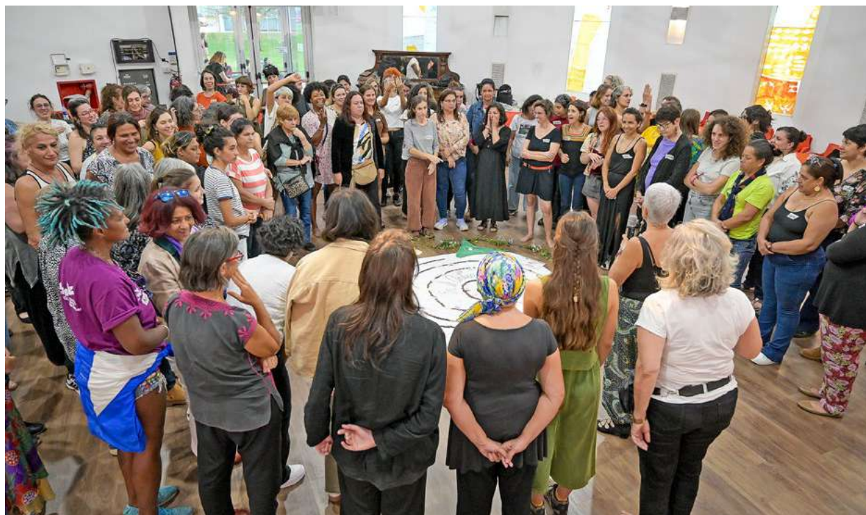
Una actividad artística durante el Primer Encuentro de Economía Feminista de Abya Yala.