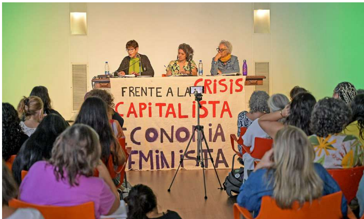
Sesión de la comisión "Tiempos y Miedos" herramientas de control del poder

y de la economía feminista, sin diluir su potencia transformador frente a los marcos institucionales.