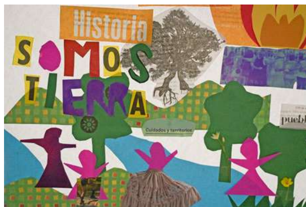
Taller de collage durante el encuentro de Economía Feminista.

aquí es donde confluyamos muchas de nosotras: el cuidado -hacia las demás, hacia los grupos que formamos, hacia nosotras mismas y hacia los agroecosistemas y los animales- es central para la reproducción de la vida y, como tal, debe tener un lugar esencial.