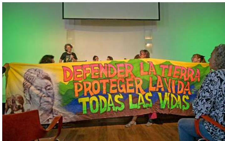
Una acción contra las políticas extractivistas en el encuentro de Buenos Aires.