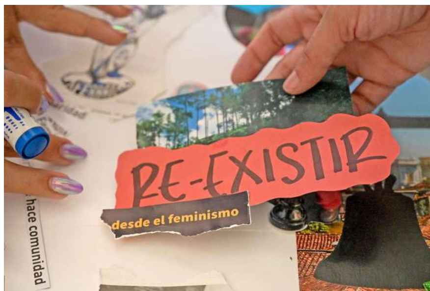
Taller de collage de la comisión de expresiones artísticas y culturales desde las economías feministas. (Natalia Roca).