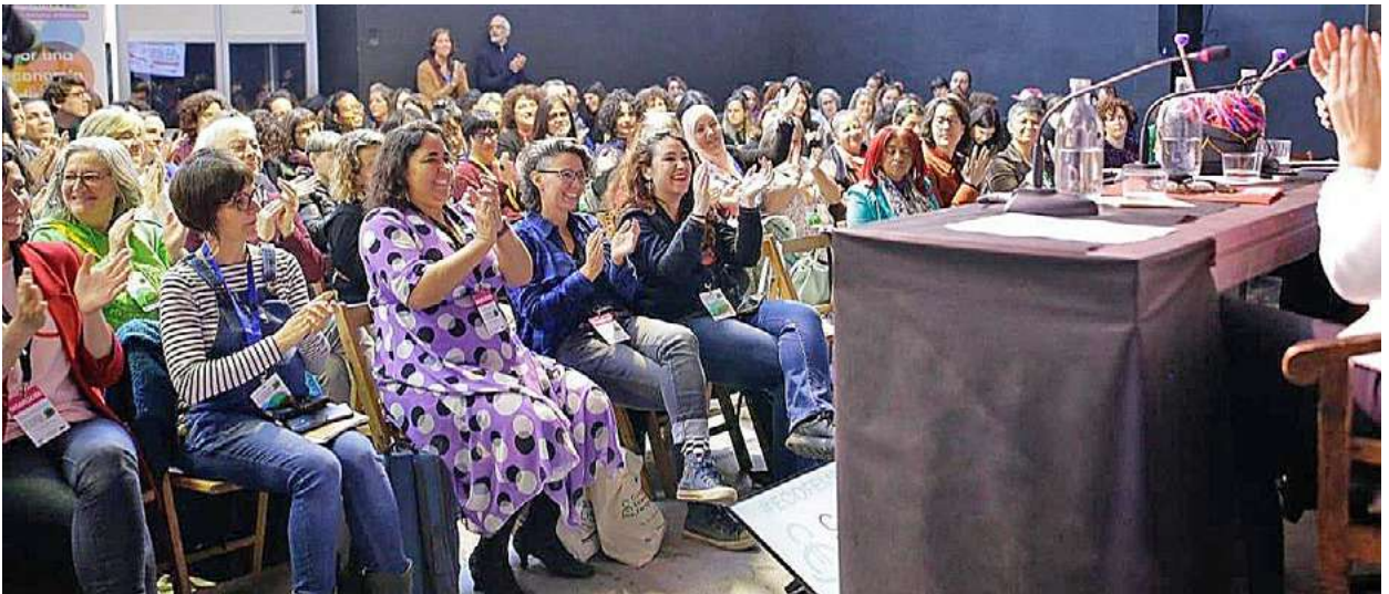
Detalle del Décimo Congreso de Economía Feminista celebrado en Barcelona en 2023.

en el centro. Son herramientas que nos permiten ver lo que ya sabemos que, por otro lado, no es lo que solemos mirar.