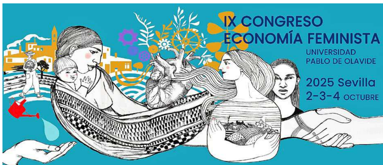
Cartel informativo del próximo Congreso de Economía Feminista que se celebrará en octubre en Sevilla.

feminismos negros, los feminismos comunitarios populares o los feminismos campesinos y agroecológicos. Nos ha dado unos lentes grandes para poder mirar la crisis y caracterizarla, no solo en el ámbito de la crisis cíclica del capital, sino que extiende la discusión a la crisis multidimensional del sostenimiento de la vida en un contexto de límites y desbordamiento. Y también está logrando pensar qué pasa con la discusión del cuidado en zonas profundamente precarias y extremadamente violentas, como las que se viven en América Latina, con el entrelazamiento del capitalismo ilegal, el narcotráfico y el crimen organizado. Y también lo que sucede con la economía de guerra, que tiene mucho que ver con la crisis cíclica del capital, pero también con el fascismo de la reproducción y nuestras sociedades.