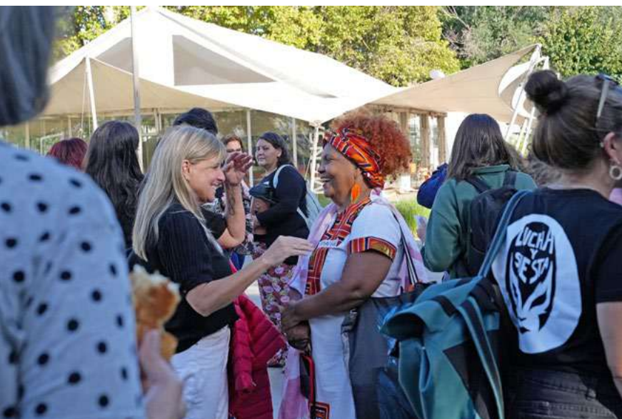
El Primer Encuentro de Economía Feminista se celebró en la sede de la Universidad Nacional de San Martín, en Buenos Aires.