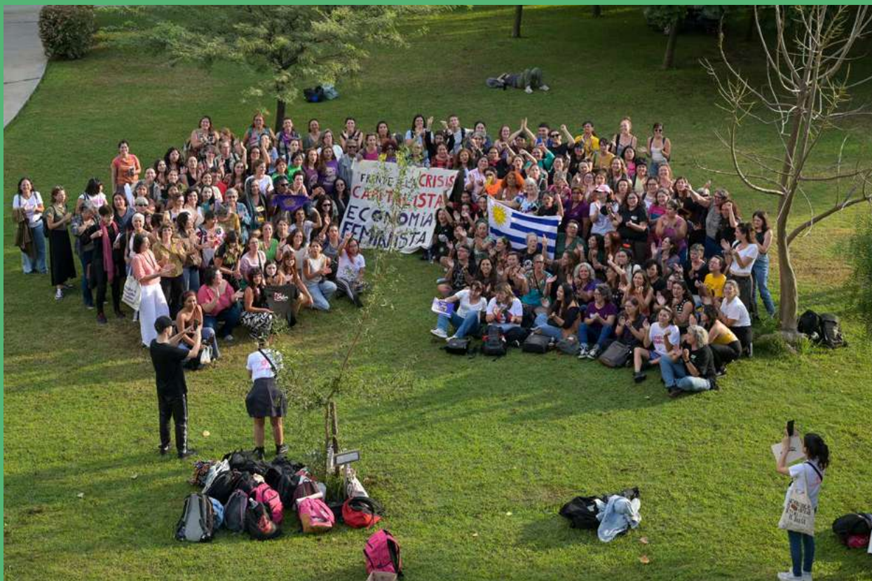
Foto de familia del Primer Encuentro de Economía Feminista de Abya Yala | EEFAY

“¡QUÉ MOMENTO! ¡Qué momento! A pesar de todo, les hicimos el Encuentro. ¡QUÉ MOMENTO! ¡Qué momento! A pesar de todo, nos hicimos el Encuentro”