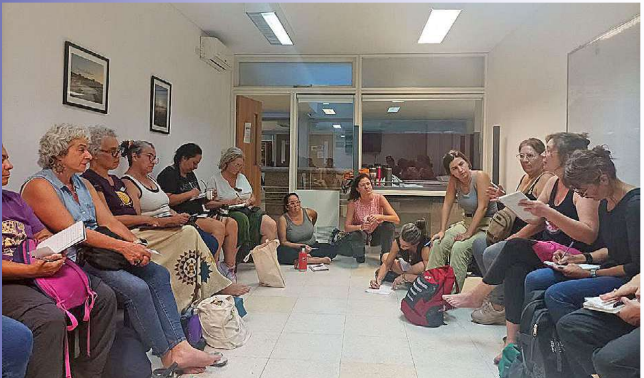
Participants al taller de Finances Feministes en Trobada d'Economia Feminista d'Abya Yala. (Lucía Cano)

Miembros de la Red de Economía Solidaria (XES, por sus siglas en catalán)