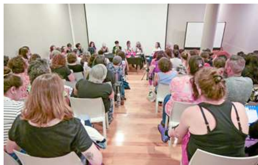
Conversación en torno al libro 'Voces desde las economías feministas'.

organización comunitaria, vínculo con la naturaleza y saberes ancestrales.