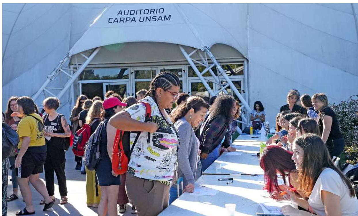
Momento de acogida y bienvenida del Primer Encuentro de Economía Feminista de Abya Yala, en Buenos Aires. (EIDAES - UNSAM).

E l Encuentro de Economía Feminista Abya Yala (EFAY), que tuvo lugar en marzo de 2025 en Buenos Aires, no podría haberse organizado sin algunas condiciones materiales decisivas. La forma que tomó la organización se asentó en una serie de pasos previos que permitieron enrutar la llamada internacional al encuentro. Una mixtura donde combinamos las formas artesanales con una increíble tecnología social e informática. Pero más que nada, nos llevó tiempo. Tiempo para escuchar, para ensamblar conexiones, para unir preocupaciones, para redoblar la creatividad.